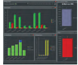
Dashboard: Alle KPIs auf einen Blick.