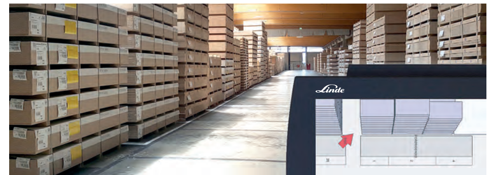
Das Staplerleitsystem navigiert den Fahrer auf dem schnellsten Weg zum Ziel.